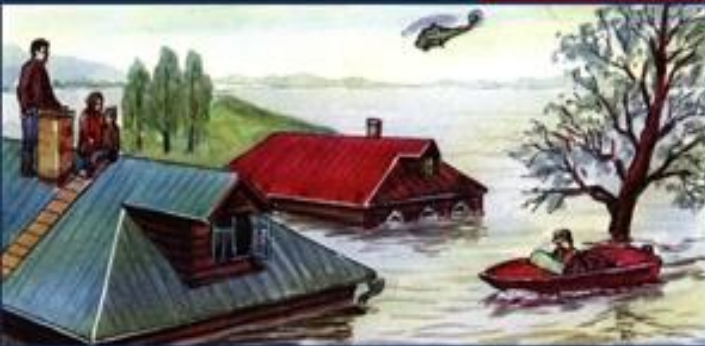
Спаси людей, где бы они ни оказались, используя для этого любые средства.