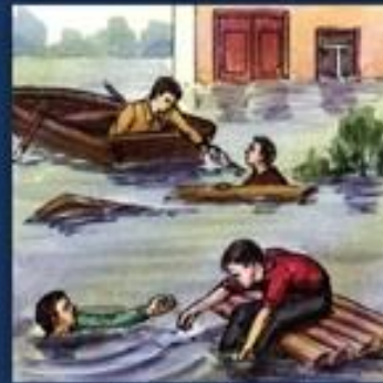
Оказать срочную помощь людям, оказавшимся в воде.