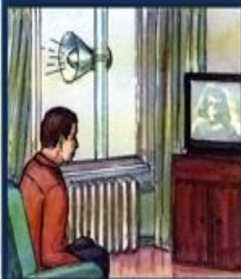
Построенно слушать информацию об обстановке и порядке действий