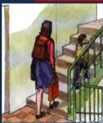
Перевести на верхние этажи продовольствие, ценные вещи, одежду, обувь