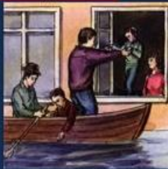
В первую очередь из зоны затопления вывести детей.